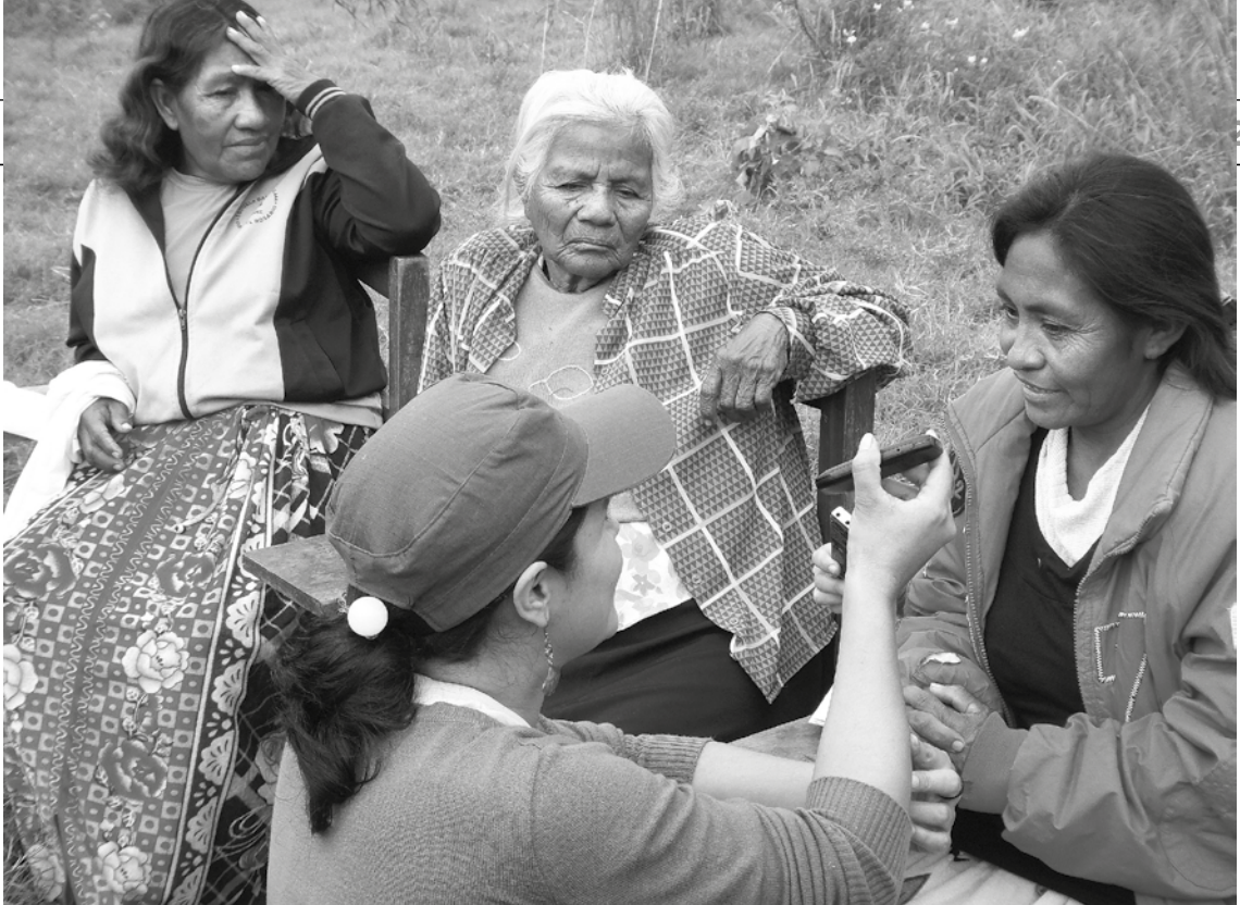
Las mujeres indígenas participan activamente en el programa radial “Devuelvan Nuestra Tierra” Que se emite a través de Radio paíPukú del Chaco.