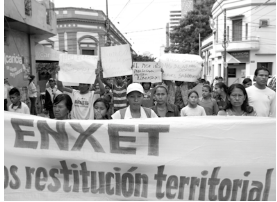
Las mujeres de Sawhoyamaya fueron las grandes protagonistas. Llegaron a la capital y se hicieron escuchar en sus reclamos por la recuperación de un pedazo de su tierra ancestral.