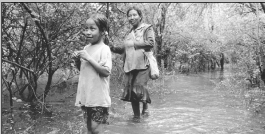
Imágenes de Yanekyaha. Una mujer y una niña en 1998.