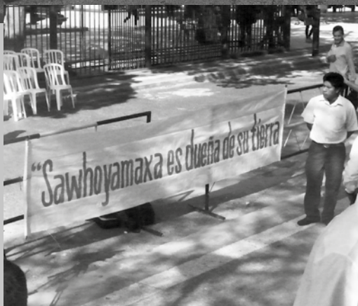
Manifestación frente al palacio de Justicia de Asunción. Los indígenas exigieron que se respete la Ley de expropiación.