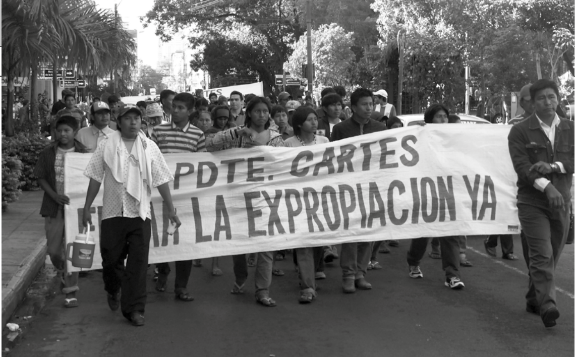
Los indígenas de Sawhoyamaxa tomaron las calles de Asunción y durante una semana marcharon hasta las cercanías de la casa de gobierno para exigir la promulgación de la Ley de expropiación.

como anteriores al Estado Paraguayo es de naturaleza declarativa y no constitutiva, por cuanto las mismas (comunidades indígenas) existen mucho antes que la vigencia de las tierras en términos de propiedad...”.