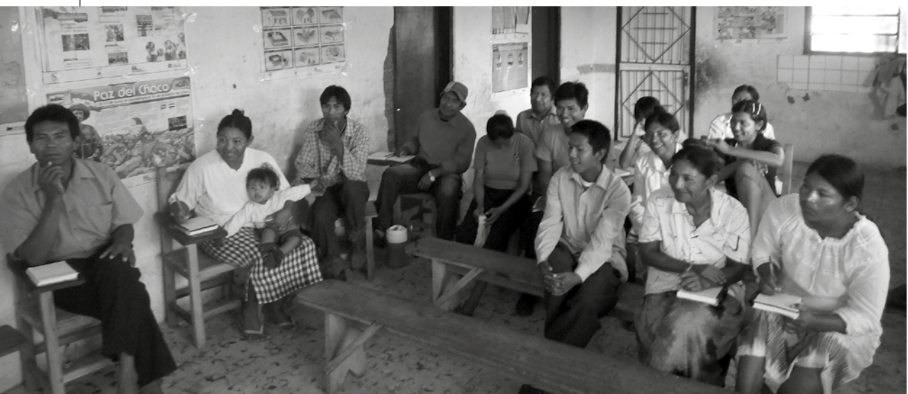
Participantes del taller de Formación Política, Comunidad San Carlos Hugua Chiní

Los desafíos ante los que se encontraban las organizaciones indígenas chaqueñas, especialmente la CLIBCh, evidenciaban la necesidad de una mayor formación política de sus integran-