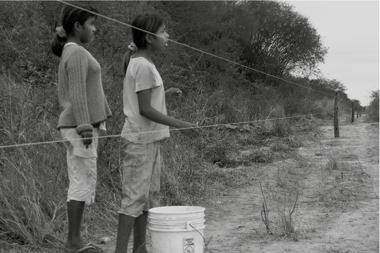
Yakye Axa: 10 años de la sentencia de la Corte Interamericana.