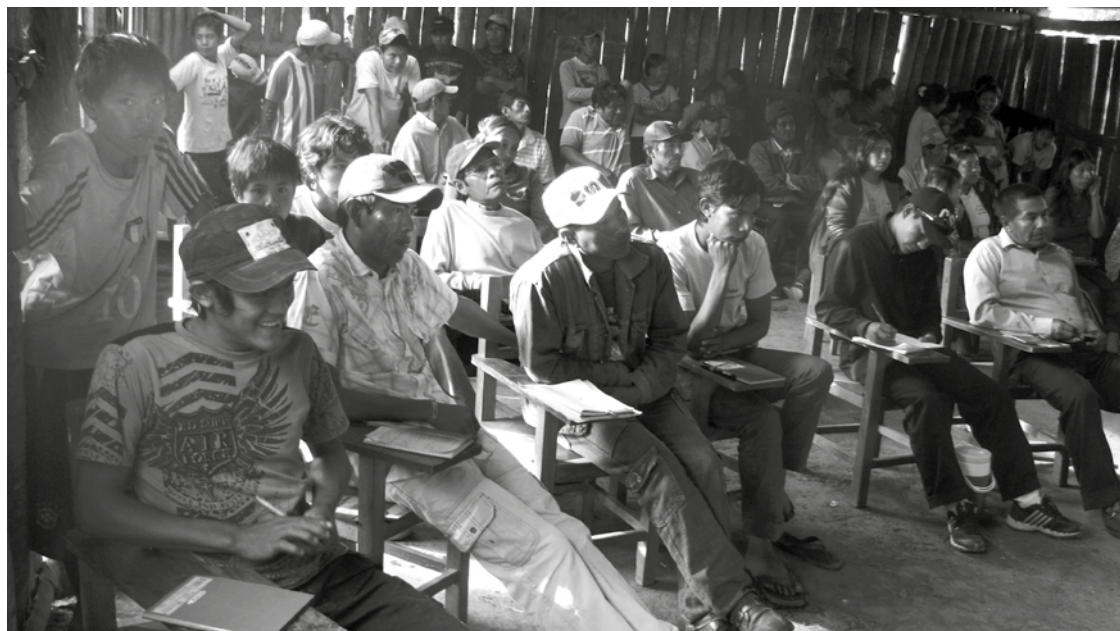
Taller de formación de la EIFP realizado en la comunidad Maxklawaiya.

tes, así como de potenciales líderes y dirigentes indígenas de las comunidades. En el acompañamiento desarrollado por Tierraviva se observó esa necesidad y por ello se inició un proceso de formación y fortalecimiento político y organizativo. La apertura mostrada por las agencias internacionales para este tipo de iniciativa permitió encaminar esta propuesta de capacitación política y fortalecimiento de las organizaciones indígenas.