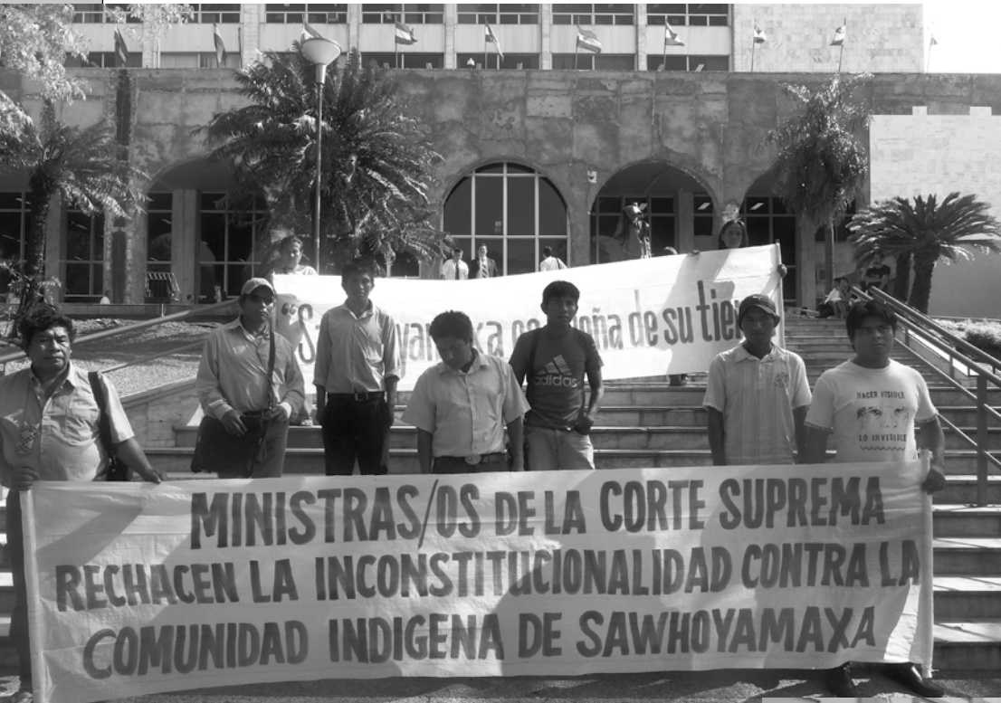
Manifestación frente al palacio de Justicia de Asunción. Los indígenas exigieron que se respete la Ley de expropiación.