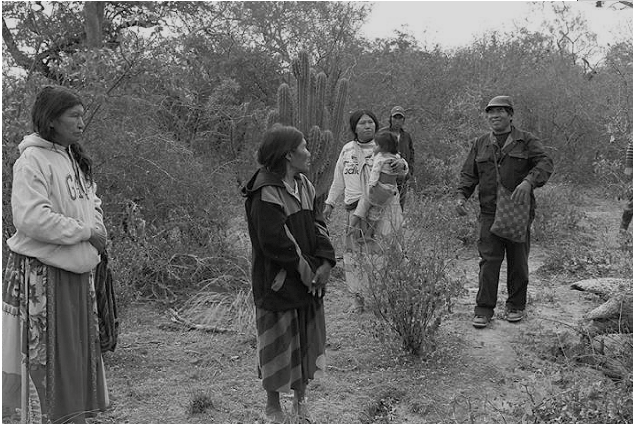
Las 25.000 hás. de la Comunidad Cuyabía fueron vendidas por el INDI, en violación a todas las disposiciones legales vigentes sobre los derechos de los pueblos indígenas.

En ese sentido, Cuyabía es - entre otras cosas - la resistencia a la superposición de títulos sobre sus tierras, a la abierta corrupción del Instituto Nacional de Desarrollo Rural y de la Tierra (Indert), a la apropiación indebida de sus recursos naturales por estancias agropecuarias de la zona, al monocultivo de soja que se profundiza en el Chaco con todas sus agresivas consecuencias, y a la manifiesta discriminación, no sólo estructural sino de una gran parte de la sociedad paraguaya, que con un evidente racismo e intolerancia, desprecia la enriquecida diversidad multiétnica del Paraguay.