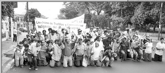
Indígenas de todo el país cerraron una parte de la avenida Mariscal López, en protesta por la modificación de la Ley 904/81 (año 2006). Los indígenas lograron el rechazo de la Ley por parte del Poder.