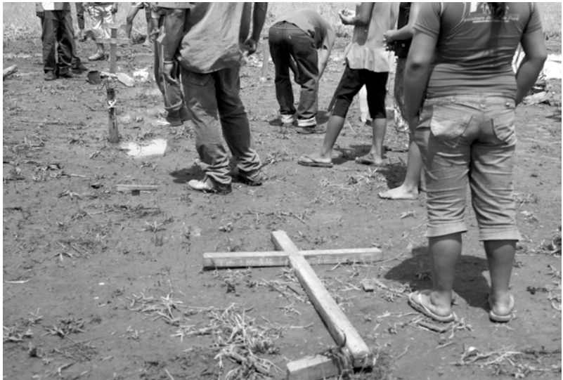
Uno de los cementerios profanados.

El informe constituyó un arduo trabajo de relevamiento de casos de violaciones de derechos humanos desde los familiares de las víctimas, referentes, líderes comunitarios y representantes de las tres asociaciones Paĩ Tavytera, como parte de una acción conjunta de denuncia y visibilización de la situación en la que se encuentran las comunidades para evitar que se sigan perpetrando. En este sentido, este documento constituye un insumo para otras acciones de exigibilidad encaminadas al cumplimiento de los derechos que comenzaron con una Audiencia Pública con diputados de la comisión de Derechos Humanos. En ésta se solicitó: (1) la regularización de tierras, (2) la garantía del libre tránsito por su territorio, (3) la investigación, imputación, condena, prisión y castigo a las personas que atentan contra la vida e integridad física de los miembros, hombres y mu-