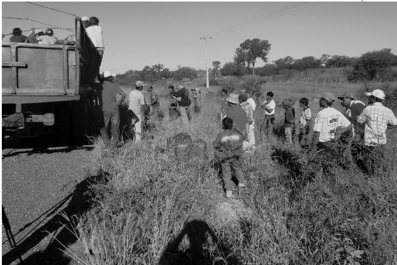
En mayo de 2013 la comunidad Yakye Axa intentó mudarse hasta su nueva tierra, pero no pudieron llegar a causa del mal estado del camino.

Las promesas hechas por el Estado a la comunidad, referentes al mejoramiento vial, datan del año 2012, cuando fue adquirido un inmueble de 12 mil hectáreas que serviría para el reasentamiento comunitario. La propiedad era parte del establecimiento ganadero “El Algarrobal”, ex Puerto Colón, ubicado en el distrito de Puerto Pinasco, distante a unos 60 kilómetros del actual asentamiento indígena de Yakye Axa