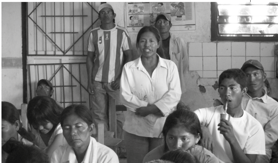
Comunidad San Carlos, Huguachini.

A partir de esta necesidad se inició, en el año 2011, un espacio de formación política dirigida a la dirigencia indígena y en especial de los jóvenes líderes y lideresas de las comunidades del bajo Chaco. Esta capacitación tenía como objetivo principal el iniciar un proceso formación política, respetando y conociendo la historia de las comunidades indígenas del Chaco, para exigir al Estado el cumplimiento de sus derechos como pueblos y comunidades.