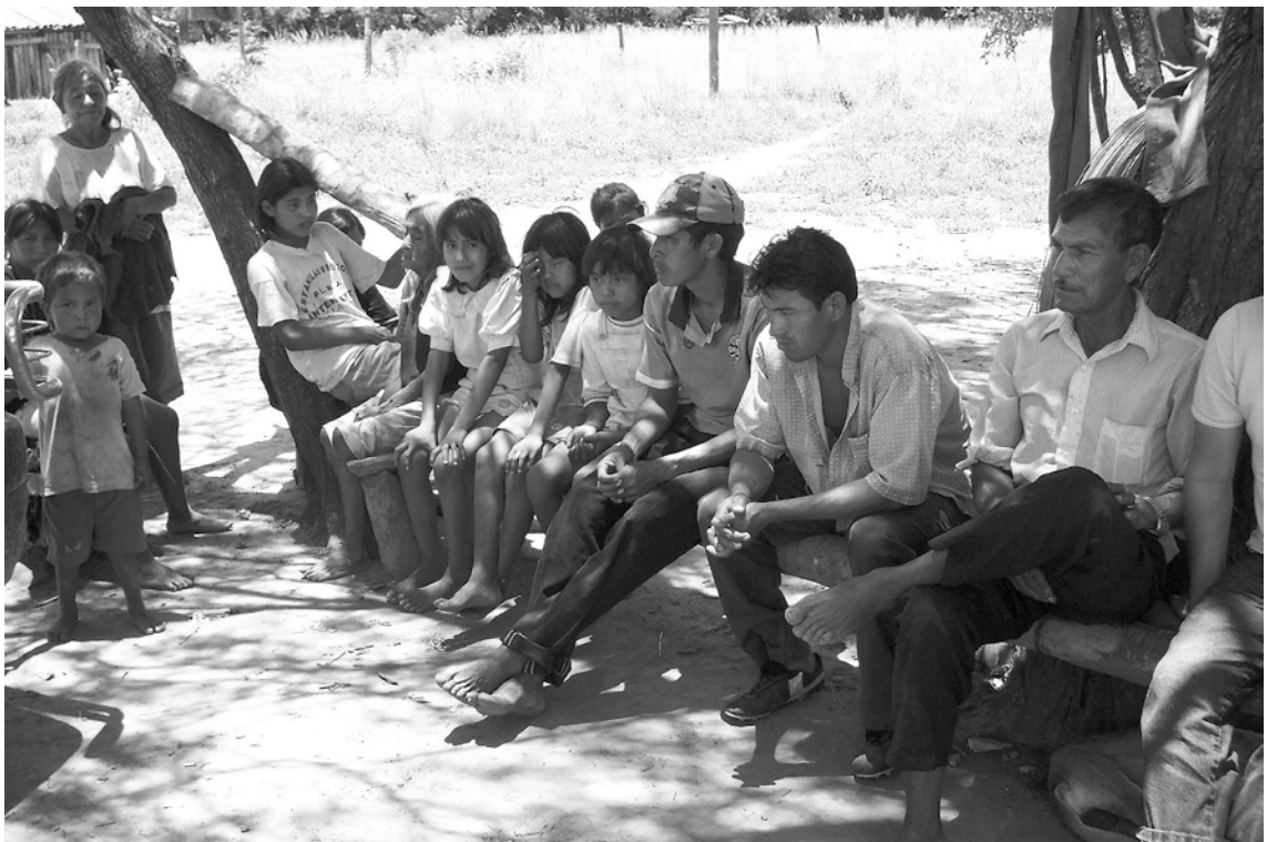
Reunión comunitaria para denunciar los casos de depredación ambiental (año 2005).

de los bosques ubicados en el sitio. En algunas ocasiones, sin embargo, se vieron obligados a movilizarse hasta la capital para exigir a las autoridades nacionales una respuesta favorable a su pedido.