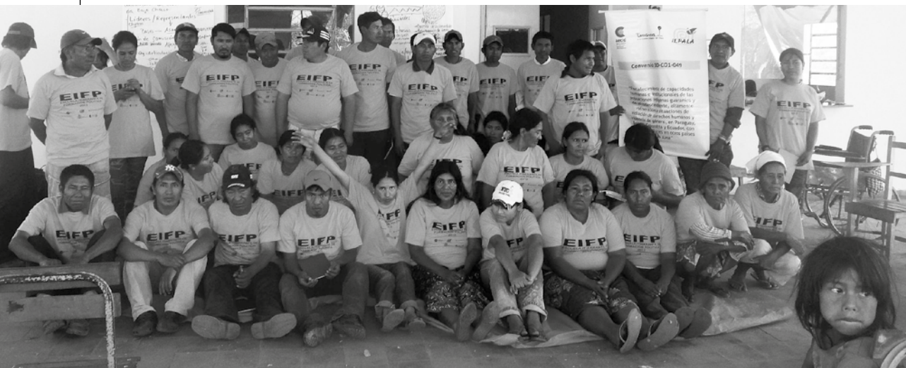
Finalización de la EIFP, comunidad Xákmok Kásek.

res, para luego ser incorporados como parte de la escuela y transmitir su experiencia a los más jóvenes. Como un aporte muy importante, se contó con la participación de ancianos y personas referentes de las comunidades, quienes hicieron posible el ejercicio de recuperación histórica y cultural, a través de compartir relatos, en la mayoría de los casos, en su propio idioma.