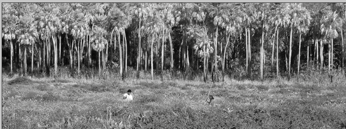
De pesca en Laguna Pato.