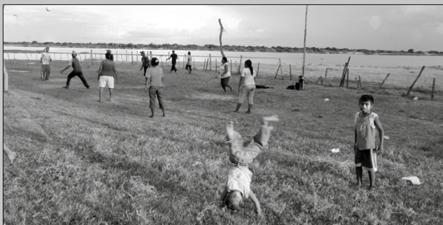
Kelyenmagategma en 2012. Los niños y niñas juegan y estudian en su territorio, en la ribera del río Paraguay.