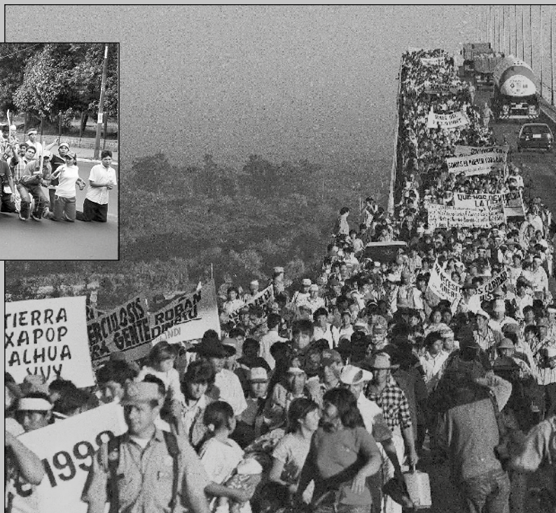
Unos 2.500 indígenas chaqueños rompieron el silencio y protagonizaron por primera vez, el 12 de octubre de 1998, esta histórica marcha.

Multitudinarias manifestaciones, como la desarrollada en 1998 cuando miembros de diversas comunidades pertenecientes a los pueblos indígenas chaqueños marcharon hasta la capital, solicitando la devolución de sus tierras ancestrales; hasta las grandes movilizaciones en contra de la modificación de las Ley 904/81, sucedidas en el 2006 y organizadas por la Fapi, la Clibch y otras organizaciones indígenas de la región Oriental, fueron acompañadas por el equipo de trabajo de Tierraviva.