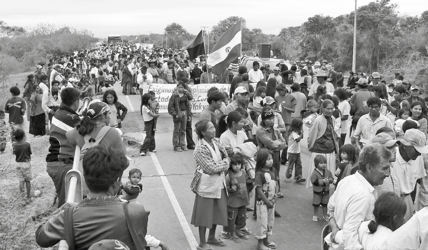
Cierres de rutas de los indígenas de Sawhoyamaza. Fueron varias manifestaciones con cierre de rutas que contó con el apoyo de otras comunidades chaqueñas.