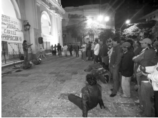
La solidaridad de los artistas no estuvo ausente en la lucha de los indígenas Enxet Sur. Numerosos artistas populares se unieron en una única voz: "Tierra para Sawhoyamaya", durante el festival realizado en frente a la catedral de Asunción.